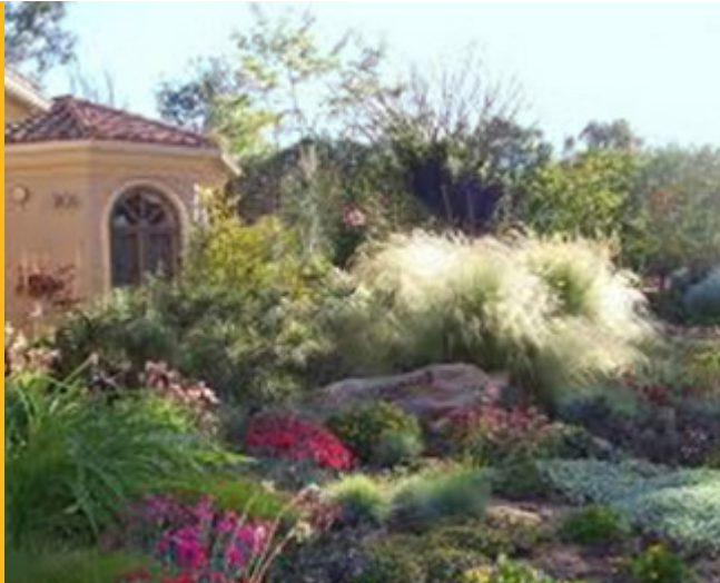
Figura 8. Hermosos paisajes resistentes a la sequía ahorran agua y tiempo.

Tenga en cuenta que el sistema de riego es realmente el que desperdicia el agua, no las plantas. Esto es particularmente cierto respecto a los sistemas de aspersores que se usan para regar céspedes y cubiertas vegetales. Evite dedicar mucho tiempo y mano de obra solo para descubrir que la causa original del su desperdicio de agua continúa existiendo. Aun cuando los céspedes de temporada fría no son resistentes a la sequía, los de temporada de calor requieren de la misma cantidad de agua como muchas otras plantas. Para reducir el desperdicio de agua y mejorar el desempeño de los céspedes, mantenga una distribución uniforme de agua en todo el césped.