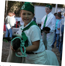
Showing a sheep at the fair