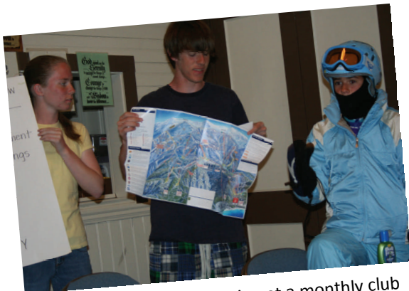
Giving a skiing presentation at a monthly club meeting