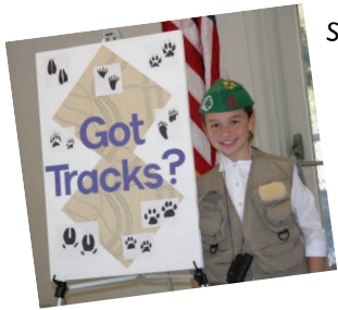
Getting ready for Presentation Day